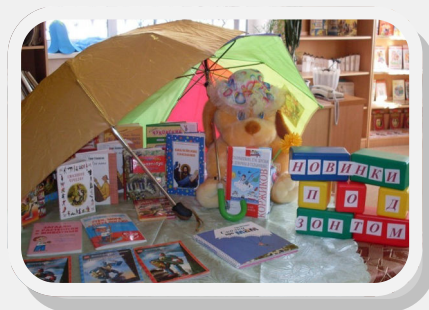
Составитель С. Л. Костевич