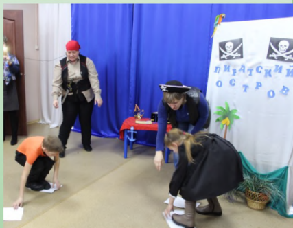
Фестиваль детского чтения